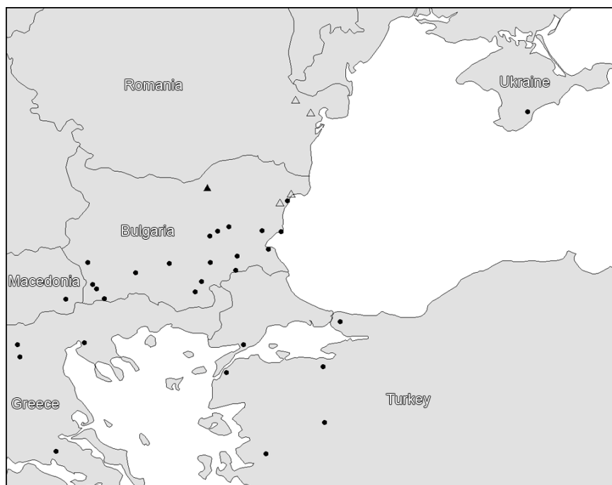
Фиг. 3. Разпространение на B. uechtritzianum (▲ – типово находище; Δ – находища, от които видът е неправилно определян като други видове) и B. asperuloides (●).

разпокъсването на природните местообитания, вследствие на отдавнашното човешко присъствие в тази равнинно-хълмиста част на Европа.