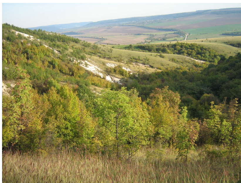
Фиг. 4. Местообитание на B. uechtritzianum (близо до село Кацелово).

ксерофити, се срещат още Fraxinus ornus L., Cornus mas L., Crataegus monogyna Jacq., Ligustrum vulgare L., Pyrus pyraeaster Burgsd., Rhamnus saxatilis Jacq., Cleistogenes serotina (L.) Keng, Carex balleriana Asso., Calamintha nepeta (L.) Savi, Satureja coerulea Janka, Teucrium polium L., Teucrium chamaedrys L., Bupleurum praealtum L., Orlaya grandiflora (L.) Hoffm., Peucedanum alsaticum L., Achillea chyeolata Sm., Cota tinctoria (L.) J. Gay, Echinops ritro L., Lactuca viminea (L.) J. Presl & C. Presl, Convolvulus cantabrica L., Onosma visianii Clementi etc. (Фиг. 4). Находището при село Острица е най-голямото от всичките и